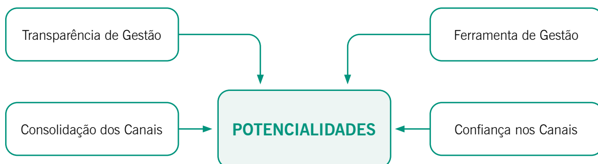
Figura 01 – Potencialidades dos canais de comunicação Ouvidoria e SIC

A análise dos dados obtidos possibilitou identificar algumas potencialidades quanto ao uso dos canais de comunicação pública, Ouvidoria e SIC do IFFar, representados pela Figura 01.