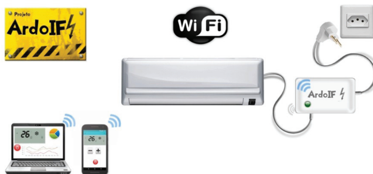
Figura 1 – Esquema macro de funcionamento