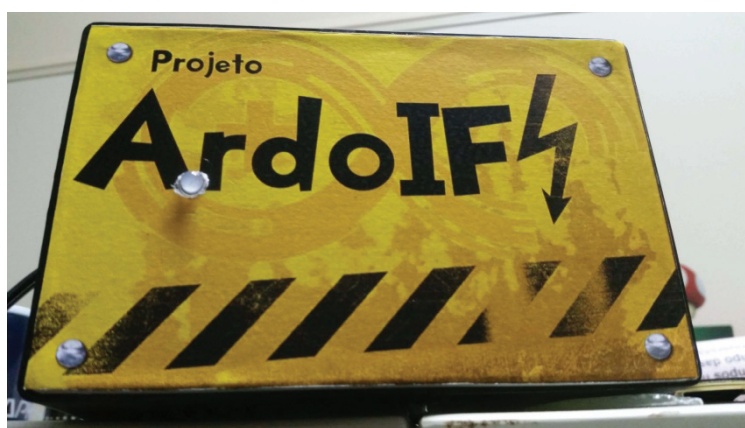
Figura 4 – Versão final de protótipo